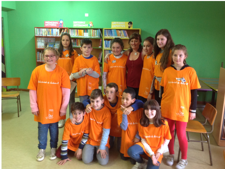
Presentación voluntariado de lectura